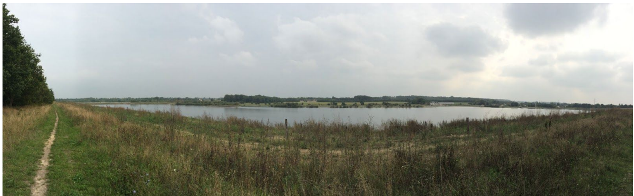
Panorama udsigt over Store Ibjergsø