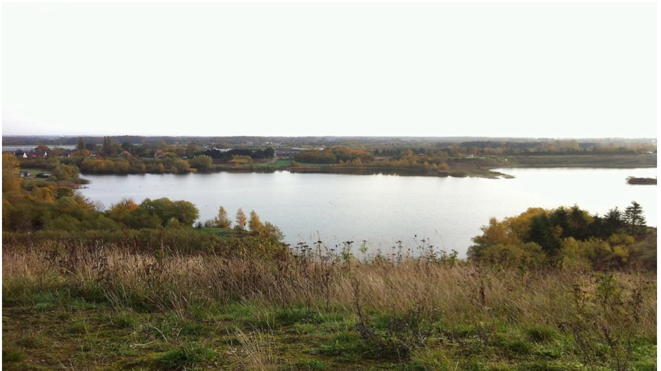
Udsigten fra Røllehøj

Løse hunde er lige som de foregående år et problem der ikke ser ud til at kunne løses. Der er stadig en hel del hundeejeren der ikke vil følge henvisningerne om at holde deres hunde i snor og det ser ikke ud til at der er noget vi kan gøre ved det.