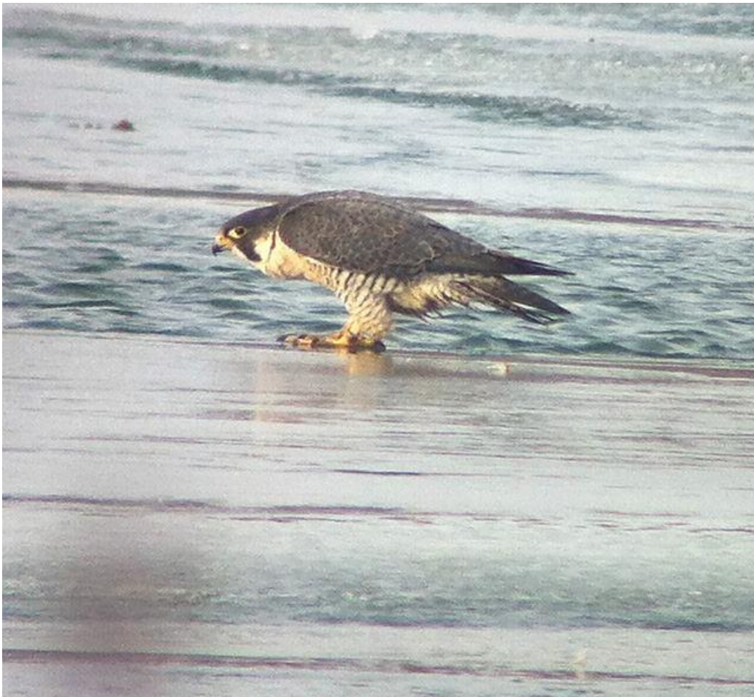
En gammel Vandrefalk hun rastede i vinteren i grusgravesområdet. Den sås ved flere lejligheder jage vandfugle ved vågerne i søerne.

Som tidligere år er ynglebestanden af vandfugle i grusgravesområdet ret konstant. Det ser ud til at alle yngleterritorier for blishøns, lappedykkere, gæs og sumpsangere er udnyttet. Det der kan få bestanden til at variere lidt fra år til år er f.eks. vinterens længde, prædation og forstyrrelser i yngletiden.