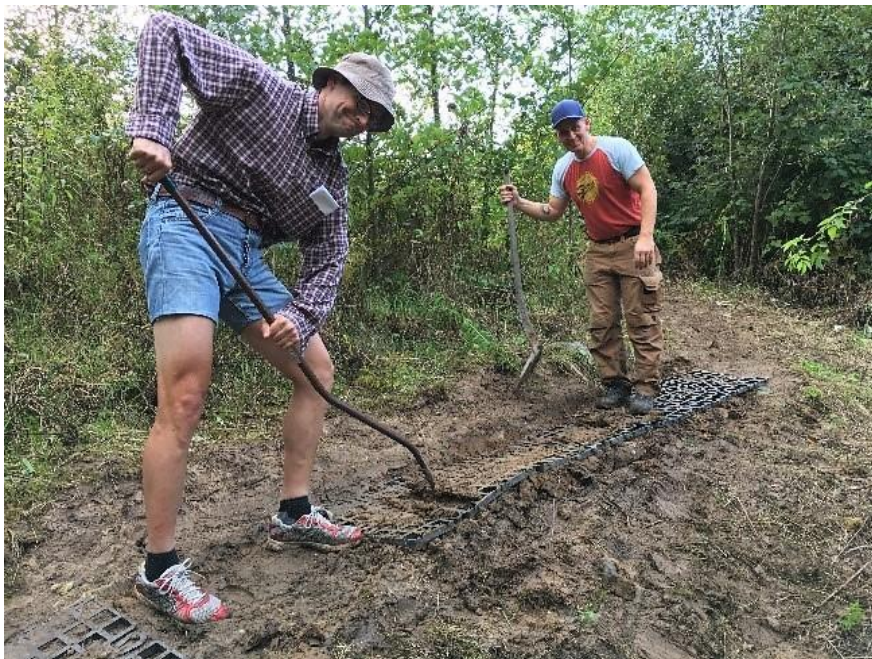
Foto: Tarup-Davinde MTB sporlaug har arbejdsdag, hvor sporene udbedres.

Sporlauget er dog et af de mere sårbare partnerskaber, da bestyrelsen er meget lille og der kun er få aktive medlemmer, til at udføre det praktiske arbejde