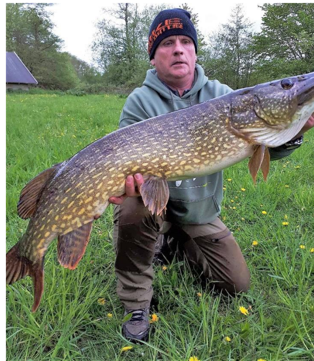
Gedde fanget ved Hudevad Sø og genudsat

Medlemmer fra Odense Sportsfisker Klub (OSK), som også dengang fiskede i området, kom med meldinger om søer, der blev tømt for fisk, ulovligt harpun- og rusefiskeri og tydeligt for alle, store mængder af affald ved fiskepladserne. Opgaven var ikke mulig at løse for TD, der manglede personale og specialviden om fiskeri.