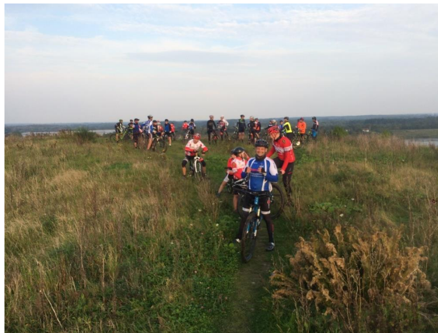
på toppen af Røllehøj

Folderen er krydret med en række små praktiske hændelser fra hverdagen i arbejdet med partnerskaber og frivillige borgere.