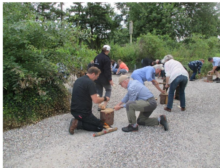
Årets frivillighedsfest styrker borgernes relationer på tværs af brugergrupper.

Det er en spændende proces, som bl.a. lægger op til at man som naturforvalter træder ud af sin klassiske forvalterrolle. Det er vores erfaring, at hvis man skal i gang med en lignende proces, så er det en beslutning som skal understøttes på ledelsesniveau.