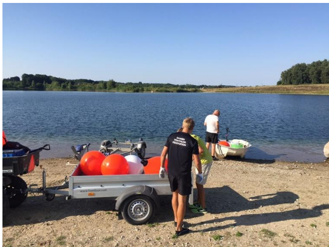
Foreningen Tarup-Davinde Åben Vand Svømmebane ligger svømmebøjer ud.

I Tarup-Davinde I/S udviklingsplan er det Fælles Mødested beskrevet, og dette projekt arbejdes der pt. på at realisere. Det er et projekt, som arbejder med at "fælles betyder at vi deler faciliteter" og i den sammenhæng er områdets partnerskaber inviteret med ind i processen, som en naturlig del af at være partnere. Foto: Foreningen Tarup-Davinde Åben Vand Svømmebane ligger svømmebøjer ud.