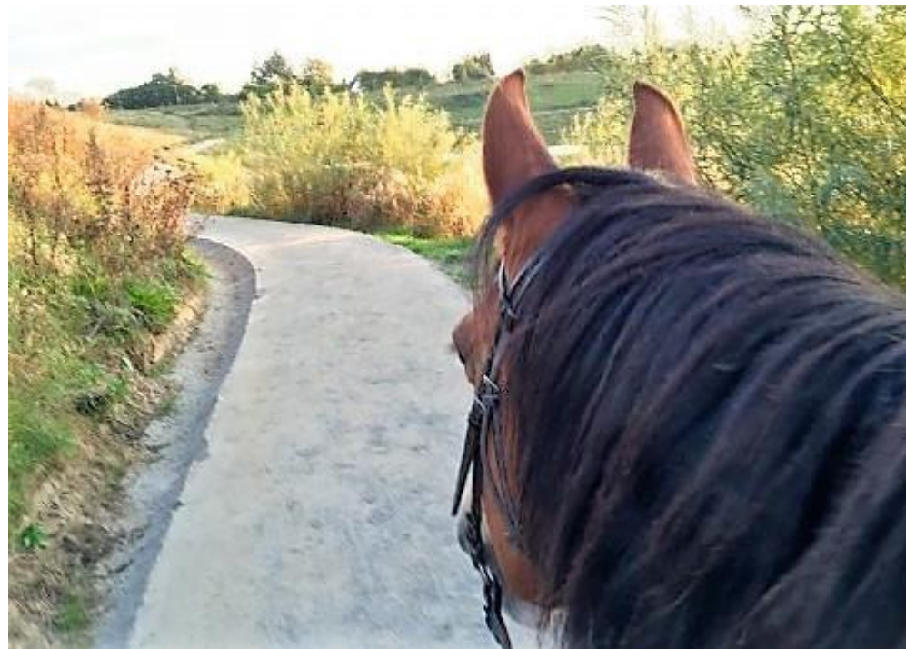
Foto: Tarup-Davinde Rytterlaug har 13 km gode ridestier, til glæde for rytterne på Fyn

Med Rytterlauget fulgte ressourcer i form af medlemmer med erfaring for projektledelse, ingeniørviden, udarbejdelse af budgetter og fundraising for ca. 1 millioner kroner, et stort stykke arbejde, som TD sandsynligvis ikke havde brugt ressourcer på uden et partnerskab.